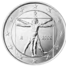
MONETA DA 1 EURO, ITALIANA, CON IL DISEGNO DELL'UOMO VITRUVIANO DI LEONARDO DA VINCI.