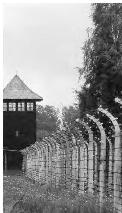
UNA VEDUTA DEL CAMPO DI CONCENTRAMENTO DI AUSCHWITZ.