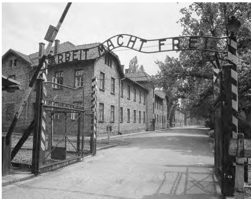
L'ENTRATA AL CAMPO DI CONCENTRAMENTO DI AUSCHWITZ CON LA SCRITTA: «IL LAVORO RENDE LIBERI».